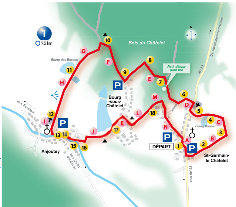
circuit n°1 Saint-Germain le Châtelet - Bourg sous Châtelet - Anjoutey